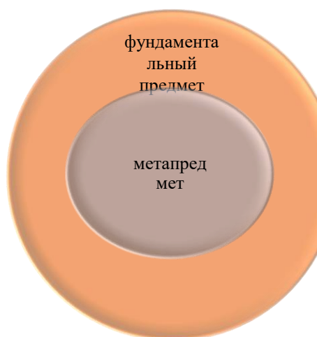
Рисунок 1 – Метапредметность по Ю.В. Громько

Таким образом, представители школы Ю.В. Громько (рисунок 1) предлагают вводить отдельные метапредметы, вырабатывающие у учащихся надпредметные навыки, которые они будут использовать, приходя на фундаментальные предметы. А представители школы А.В. Хуторского считают, что нужно вводить метапредметное содержание на каждом предмете и дополнять это метапредметами. Тем самым школа А.В. Хуторского рассматривает образование не только как развитие мыслительной деятельности школьника, но и эвристической, продуктивной, рефлексивной.