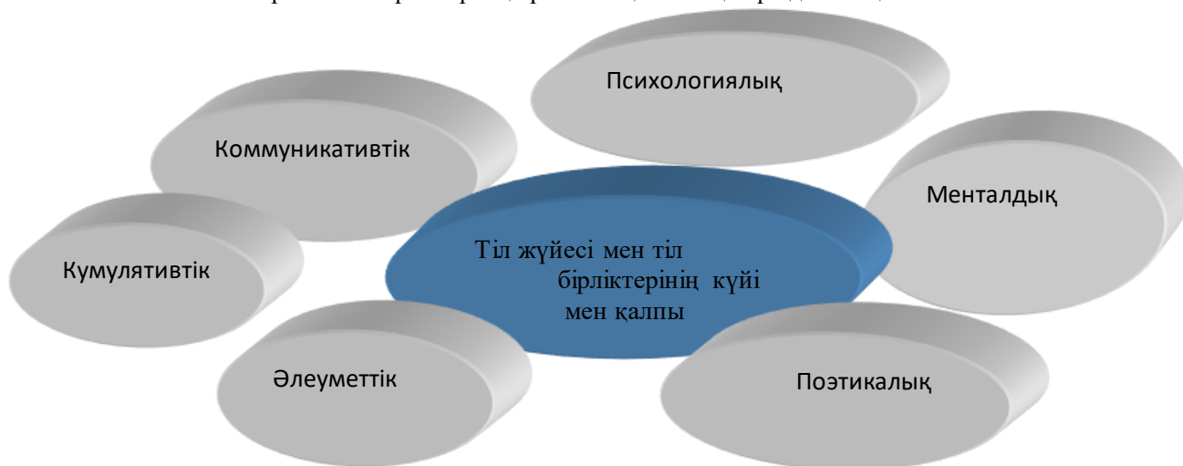
2 кесте – Тіл жүйесі мен бірліктерінің күйі және қалпының парадималық болмысы

Психолингвистердің бірқатары физиология мен нейропсихологияның жетістіктеріне сүйене отырып, тіл жүйесінің деңгейлерін фондық деңгей және жетекші деңгей деп екі бөліп қарастырады [5, 201 б.]. Л.Н. Мурзин фонетика морфемдік деңгейлерді фондық деңгейге, ал, лексикалық және синтаксистік деңгейлерді жетекші деңгейлерге жатқызады [6, 109 б.]. Қазіргі заман психологиясының асамаңызды артықшылығын танытқан ғылыми ағым когнитивтік психология. Когнитивті психологияның негізгі зерттеу аймағы