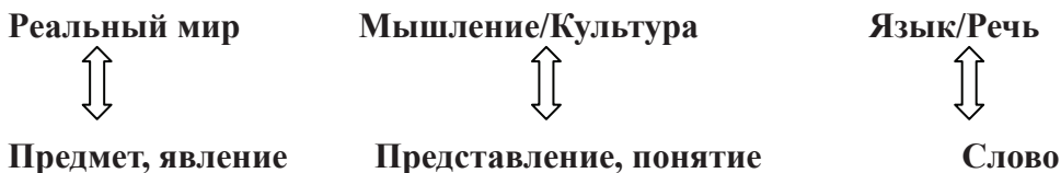
Рисунок 1 – Схема соотношения между реальным миром и языком

Окружающий человека мир представлен в трех формах: